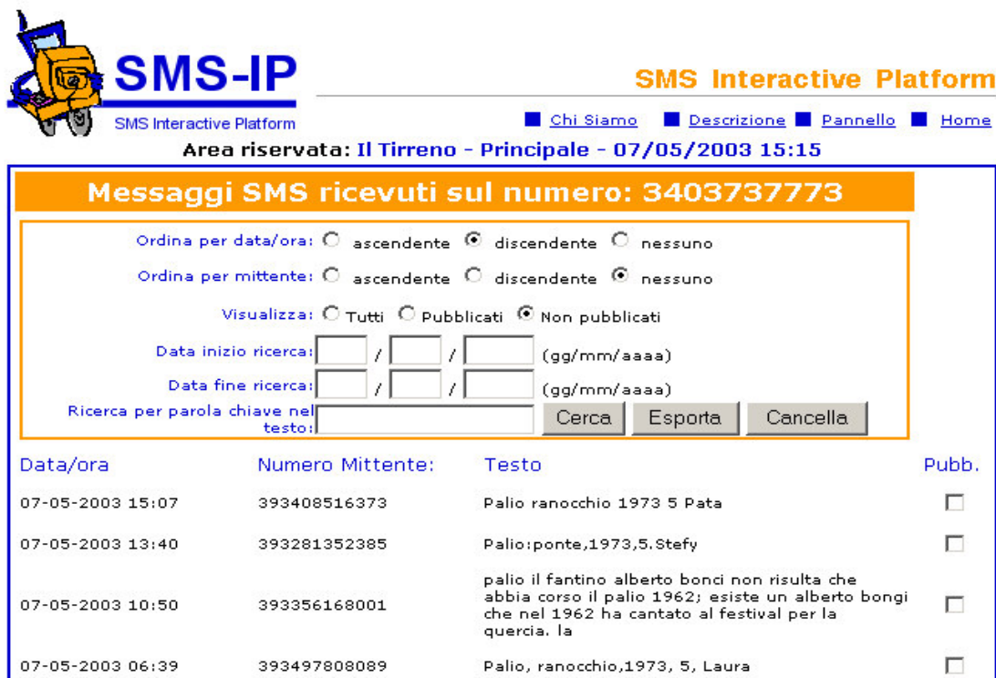
Figura 8. Ricezione messaggi SMS

In questo modo è possibile avere una generica ricezione di messaggi per ciascuna redazione, ed utilizzare invece la ricezione generale senza chiavi per eventuali iniziative di più ampio respiro a livello di intera diffusione.